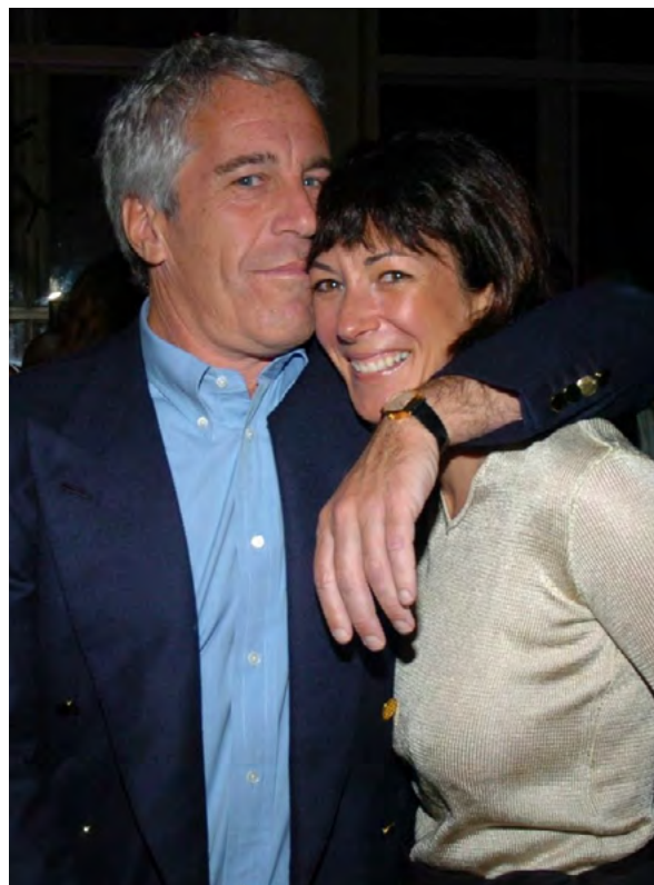
Jeffrey Epstein y su íntima amiga, Ghislaine Maxwell.

Recuerdan el caso de Jeffrey Epstein, el famoso multimillonario que organizaba fiestas pedófilas en su isla privada, llamada “Little Saint James”, en la cual invitaba a políticos, celebridades y personalidades importantes, el cuál fue apresado en una cárcel de máxima seguridad y que, según las autoridades, se “suicidó” en una celda anti suicidios de Estados Unidos. Epstein tenía pruebas contundentes en contra de varias de estas personalidades invitadas a la isla y que, incluso realizaban rituales con los menores.