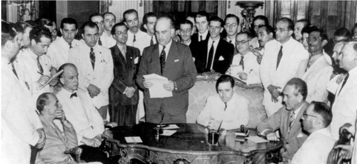
Firma del Protocolo de Río de Janeiro, el 29 de enero de 1942.

norteamericana, que se vio más afectada cuando en Enero de 1942 tuvo que someterse a los dictámenes del Departamento de Estado y tuviera que firmar el oneroso Protocolo de Río de Janeiro y de esa manera permitir que las unidades militares peruanas abandonaran algunas de las zonas ocupadas.