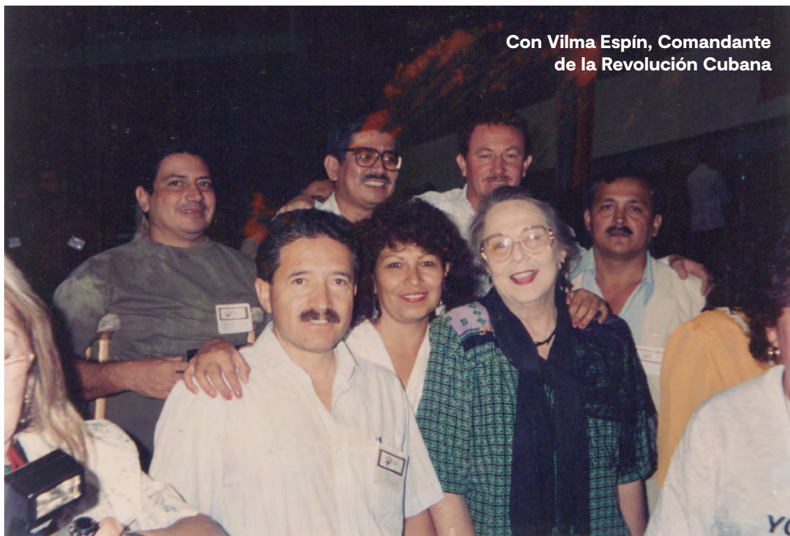
Con Vilma Espín, Comandante de la Revolución Cubana