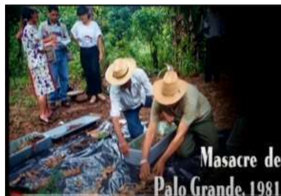
Expertos iniciaron exhumación de campesinos en San José Palo Grande, Suchitoto

Masacre en San José Palo Grande, municipio de Suchitoto, Departamento de Cuscatlán. 45 víctimas; responsable: Fuerza Armada. Caso sin justicia.