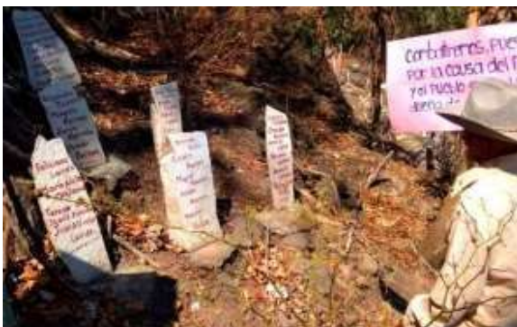
Memoria contra el olvido: comunidades conmemoran masacre de Piedras Coloradas cada 18 de marzo

Se registra la masacre en Piedras Coloradas, Caserío San Jorge, municipio de Victoria, Departamento de Cabañas. 48 víctimas, responsables: Batallón Victoria del Destacamento Militar N°2, y Batallón Atlacatl. Caso impune.